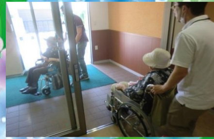
6月8日には消防立ち合いのもと、防火訓練を行いました。皆様、一生懸命に取り組まれました。

梅雨の季節になりました。日中は日差しも強く、いよいよ夏が近づいています。今回は初の試みでしたが、菖蒲湯を実施しています。皆様菖蒲の香りを楽しまれました。防火訓練では、近くの公園まで避難を行いました。地域の方のご協力もあり、素早く避難する事が出来ました。これから暑い日が続きますので体調管理にお気を付け下さい。 南洲の杜 職員一同